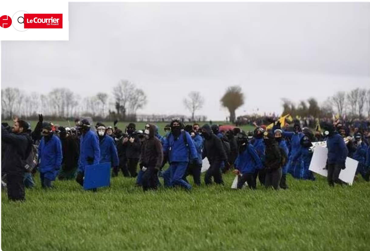
La préfète a demandé aux personnes pacifistes de quitter Sainte-Soline.