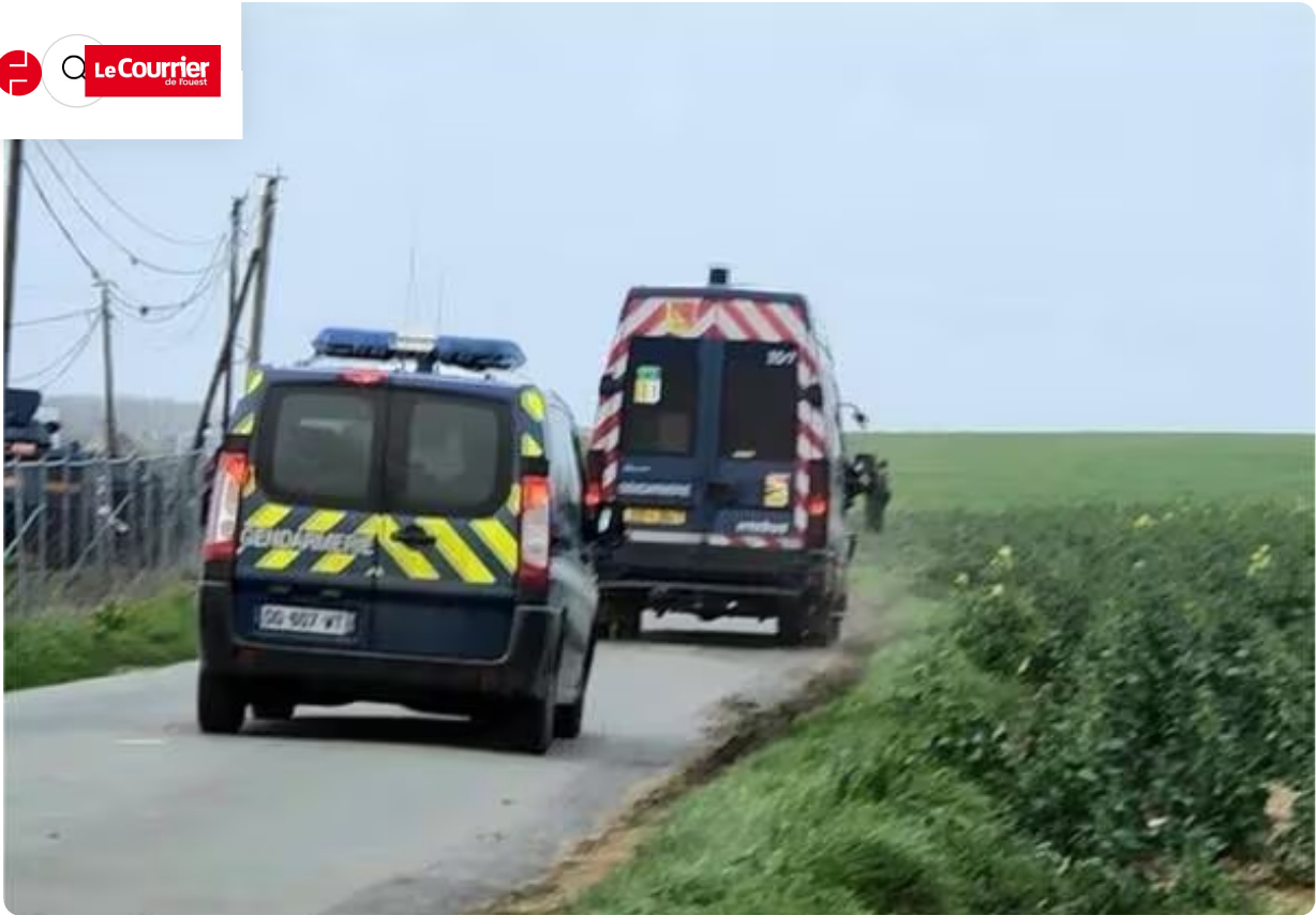
Direction Sainte-Soline pour ces gendarmes.

Un peu avant 14 heures, l'ordre est donné à deux compagnies de gendarmerie basées à Mauzé-sur-Le-Mignon de rejoindre Sainte Soline. Les forces de l'ordre commencent à encercler les militants. Elles arrivent par de petits chemins.