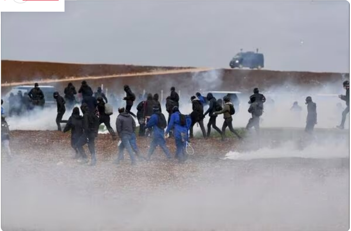
Des groupes de manifestants de plus en plus isolés.