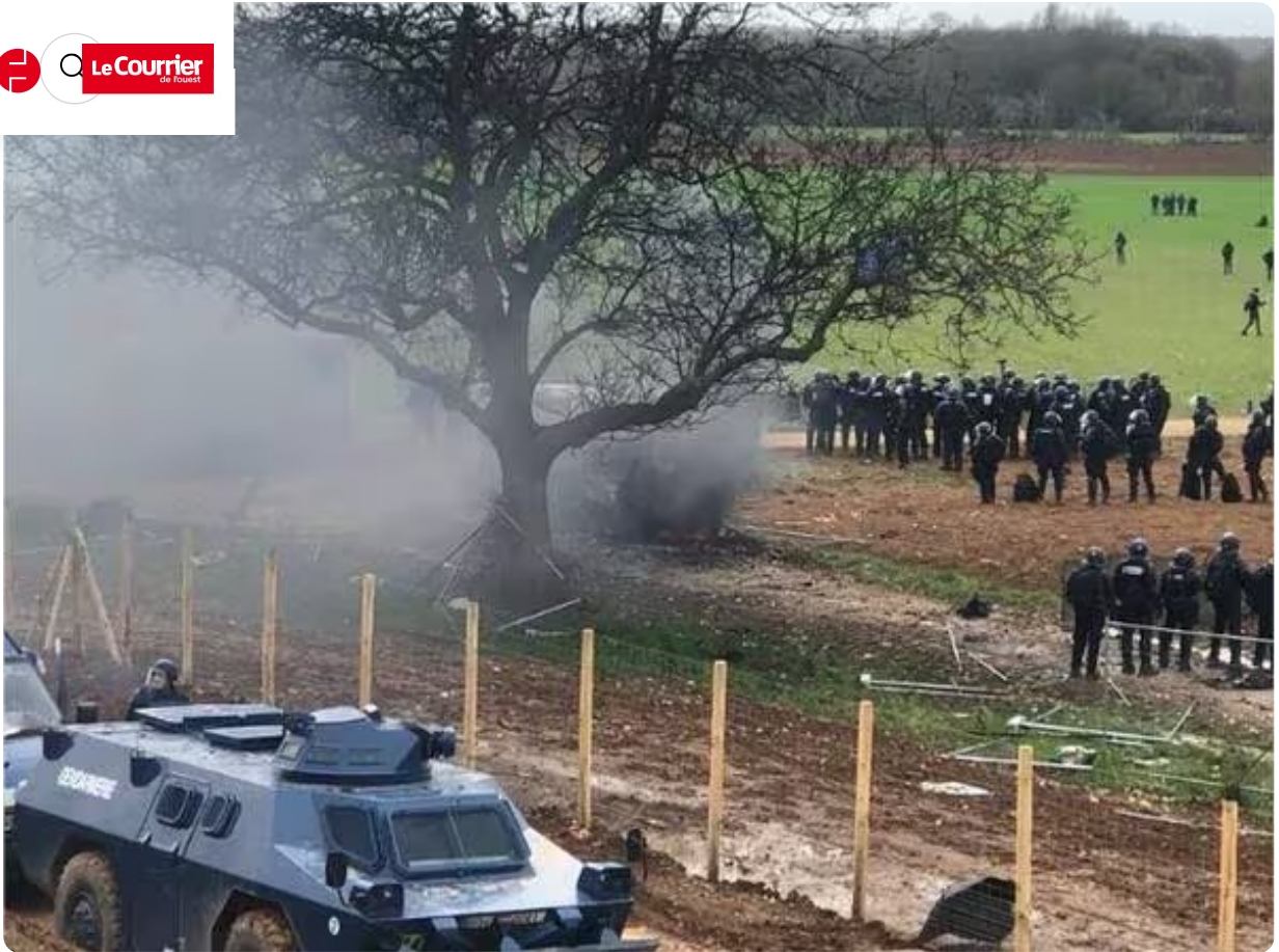
Une partie des manifestants quittent le site.

Selon la gendarmerie, la dispersion des manifestants a été une nouvelle fois ordonnée alors que les services de secours ont des difficultés à accéder aux blessés et qu'au moins quatre ambulances sont stationnées aux abords du site.