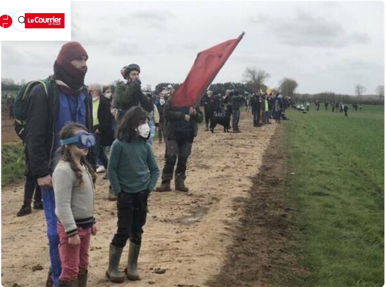
Des enfants se sont précautionneusement mis à l'écart.

Des manifestants, accompagnés d'enfants, observent les affrontements, un peu à l'écart. Pendant ce temps-là, les forces de l'ordre font savoir que mortiers et explosifs sont utilisés contre les gendarmes.