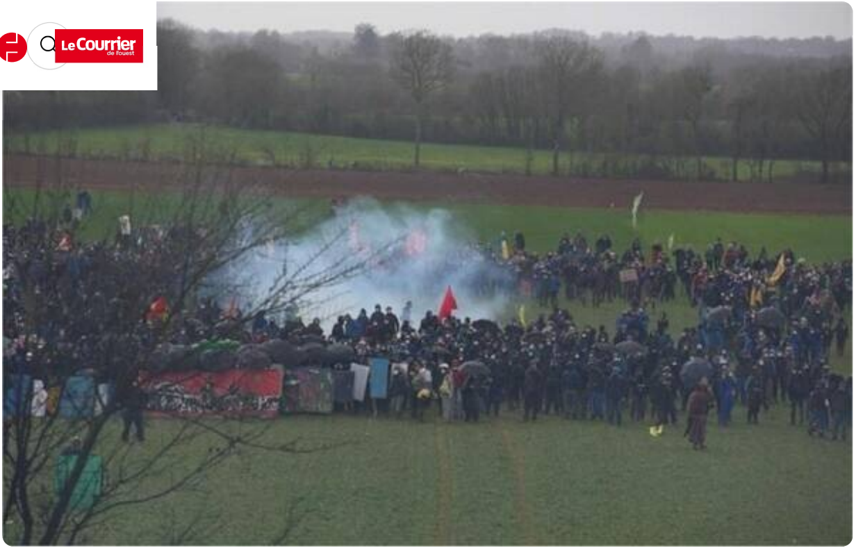
Ne restent que des irréductibles.

A la demande de Bassines non merci !, les manifestants ont repris la direction du camp de base. La gendarmerie indique que la phase de secours aux différents blessés se poursuit et que les gendarmes escortent les ambulances