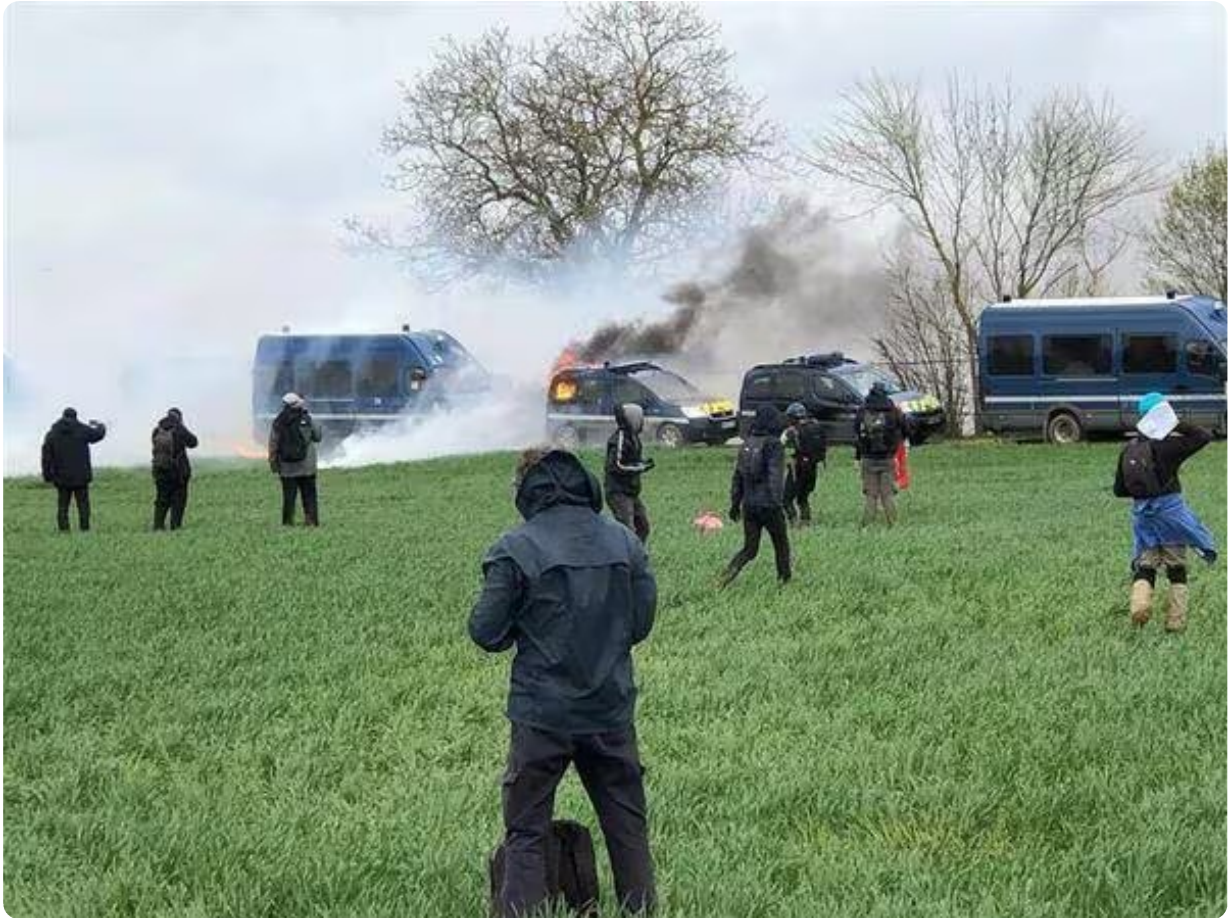
Les gaz viennent de partout.