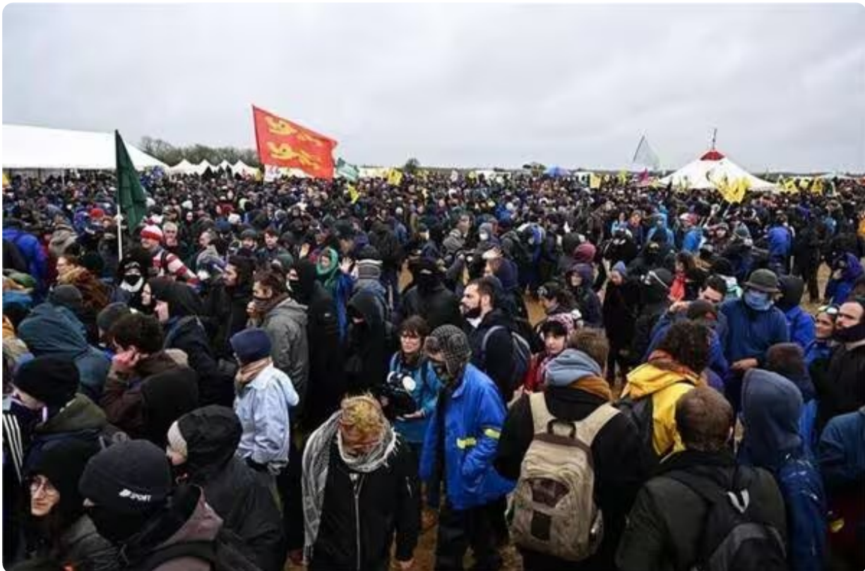
La foule, pacifique, un peu plus tôt dans la journée.