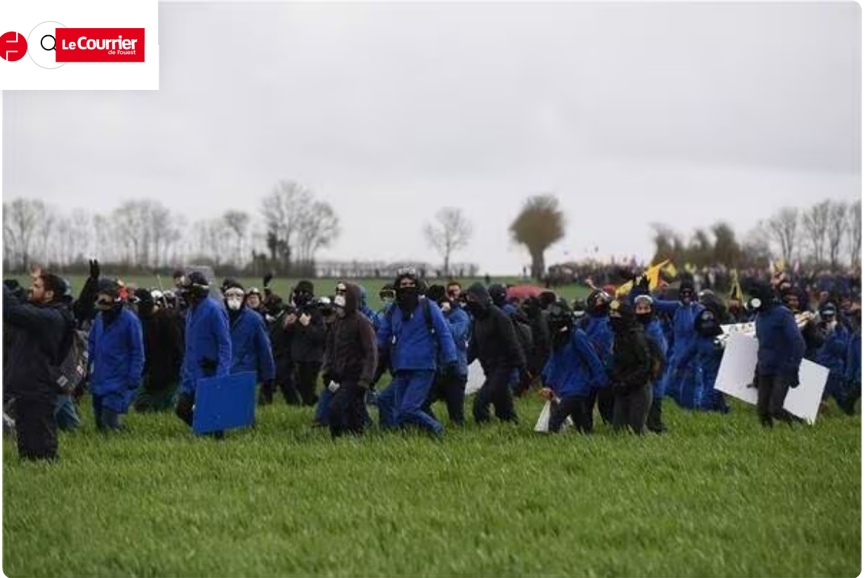
Les cortèges convergent.

12h39 Manifestations anti-bassines en Deux-Sèvres. Premiers heurts à l'approche de la bassine de Sainte-Soline