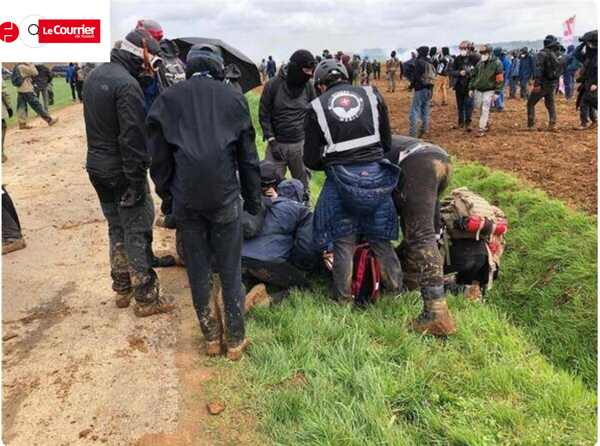
L'homme a été pris en charge.