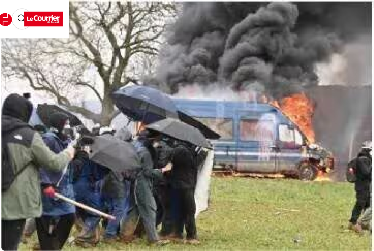
Les parapluies ont servi.