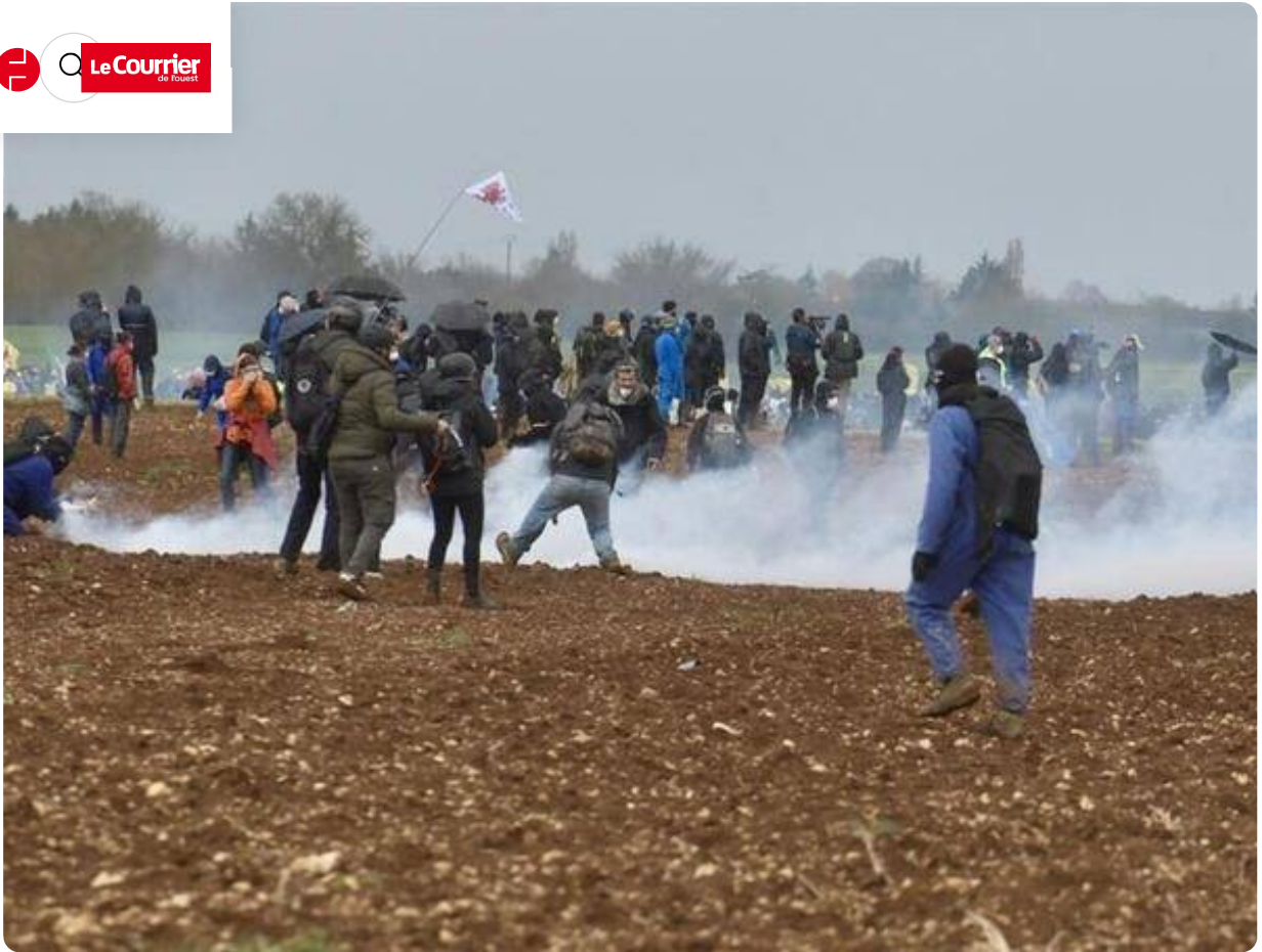
Les fumées envahissent les lieux.

Les heurts s'intensifient à Sainte-Soline. Ceux qui étaient venus pour en découdre sont entrés en action. Plusieurs blessés chez les manifestants. Les grenades répondent aux cocktails. Des militants semblent avoir créé une brèche mais les grenades redoublent molotov et tirs de mortier