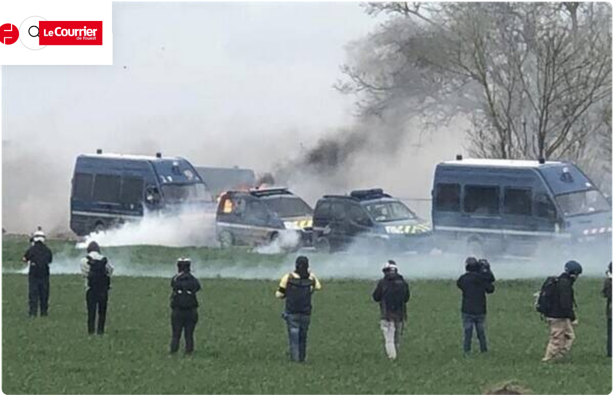
Au moins deux véhicules de gendarmerie ont été incendiés.