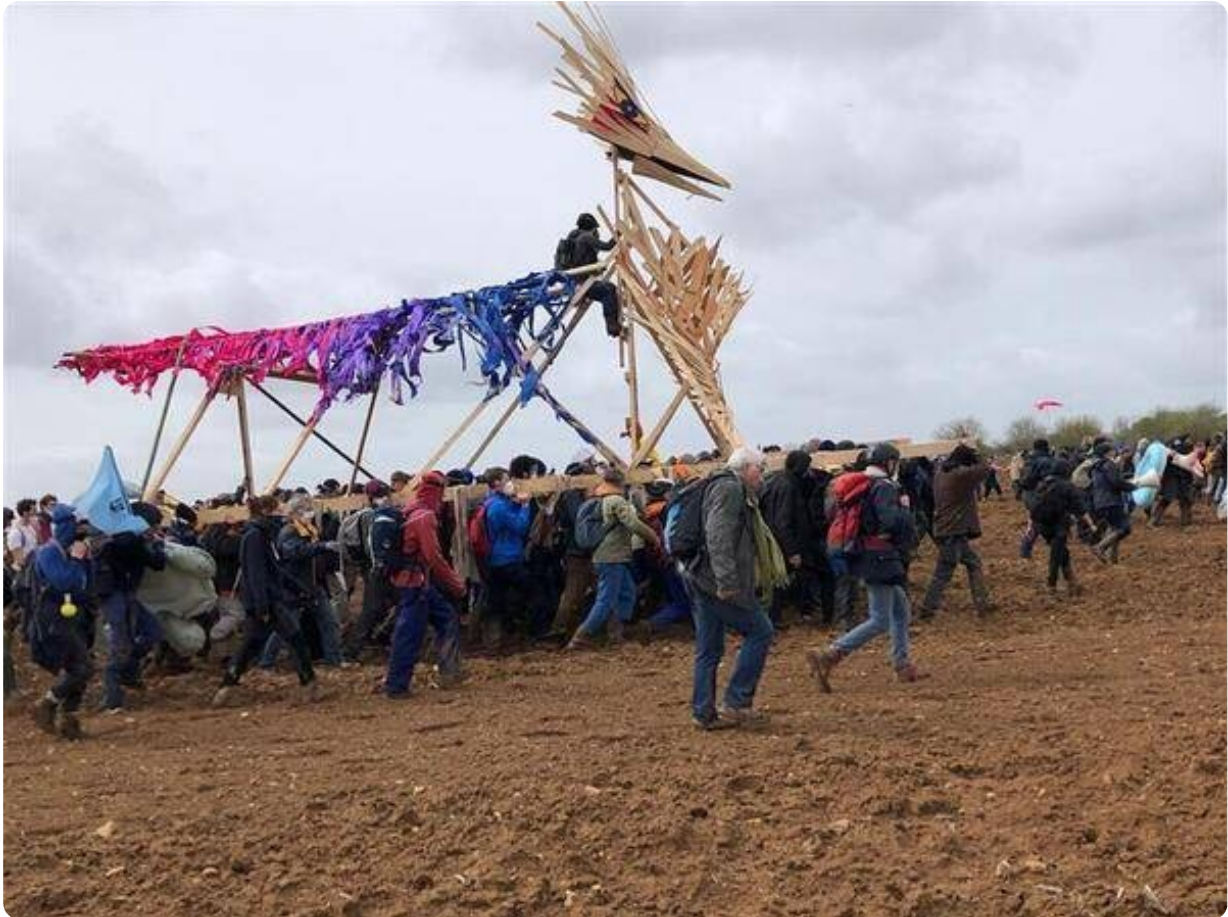
Droit sur la bassine.

La bassine de Saine-Soline est à quelques centaines de mètres. L'objectif est toujours d'encercler la bassine et donc les forces de l'ordre.