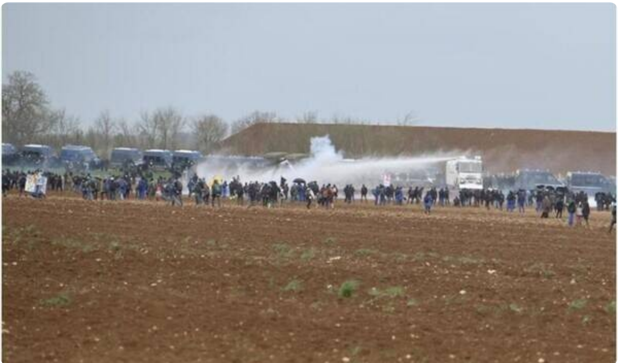
A l'approche de la bassine toujours des tirs de lacrymogènes.