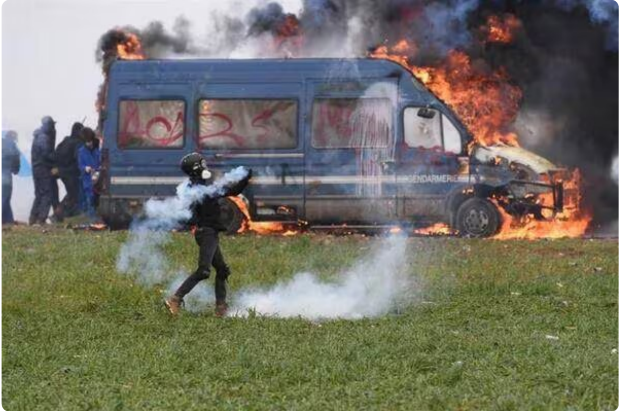
Un véhicule de gendarmerie a été entièrement embrasé.

Après une accalmie, les affrontements ont repris de plus belle à Sainte-Soline.