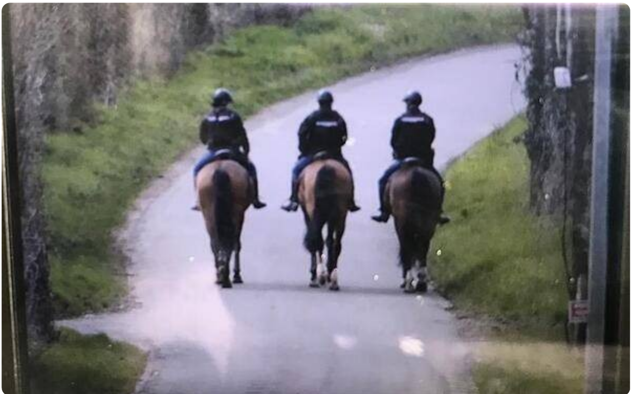
A cheval.

A cheval ou dans les arbres : tous les moyens sont bons aux forces de l'ordre pour assurer la surveillance de la manifestation.