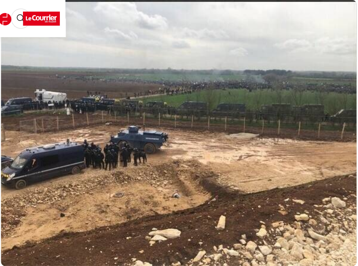
Vue générale sur la plaine de Sainte-Soline.

15h03 Manifestation anti-bassines de Sainte-Soline. Les affrontements à l'arrêt, la foule reste compacte