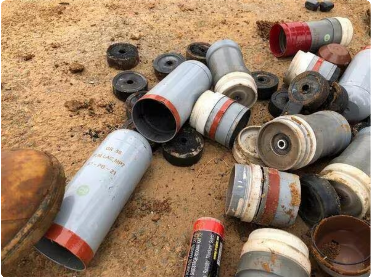
Quelques uns des projectiles utilisés.

Selon la Gendarmerie et le ministère de l'Intérieur, 4 000 grenades au total (désencerclement et lacrymogènes) ont été utilisées lors de cette journée de manifestation en sud Deux-Sèvres. " Au cours des opérations de maintien de l'ordre aujourd'hui, les gendarmes ont fait face à des individus extrêmement violents. Dans ce contexte, ils ont fait un usage proportionné de la force, en utilisant massivement du gaz lacrymogène. Pour préserver leur intégrité, les militaires de la gendarmerie ont dû également avoir recours à des grenades de désencerclement, et, dans les moments de grande tension, ont été amenés à utiliser le LBD ".