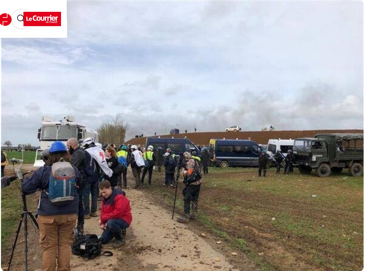
Un peu de calme après la tempête.

Les affrontements se sont arrêtés pour l'instant mais une foule compacte reste à côté de la bassine encore.