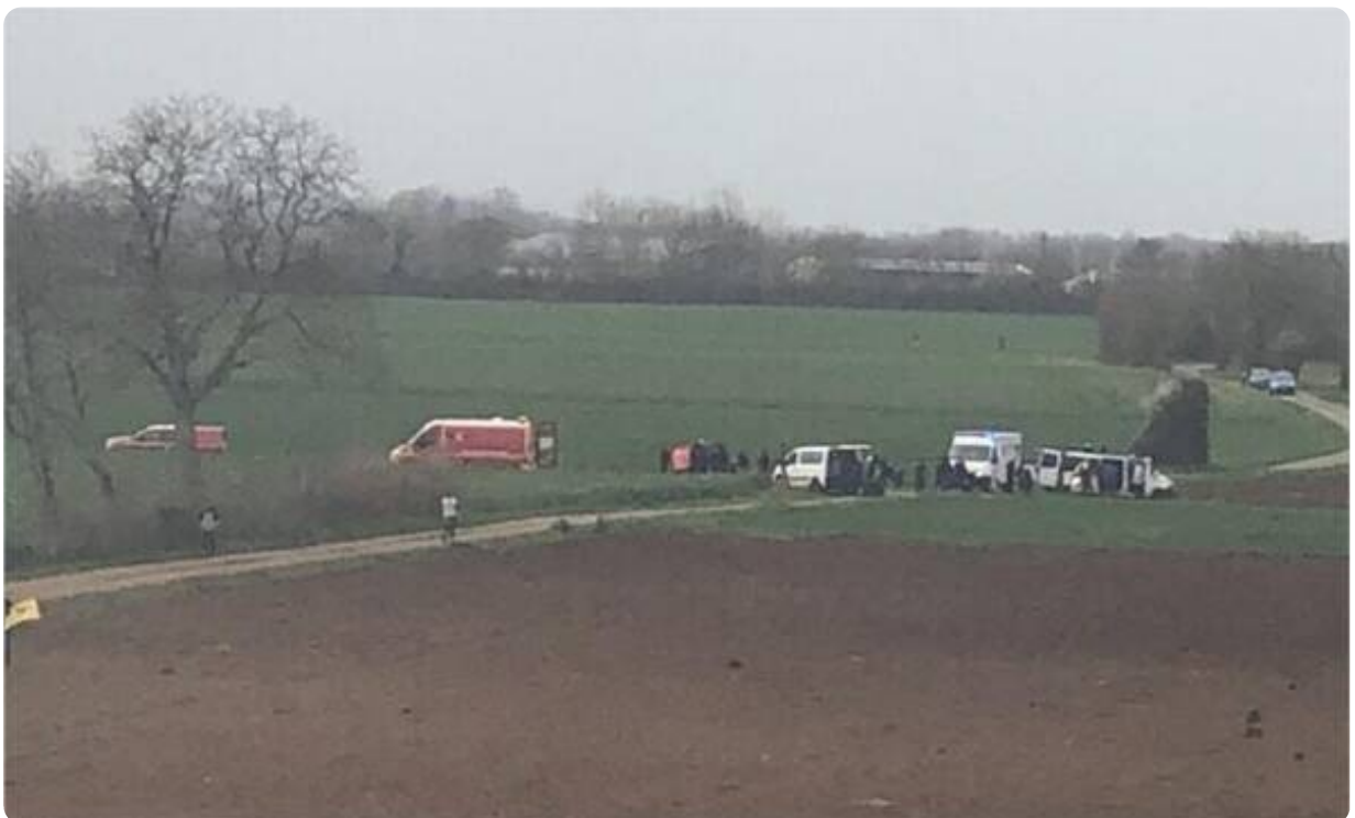
Les ambulances stationnées à côté du site.

Selon la gendarmerie, la dispersion des manifestants a été une nouvelle fois ordonnée alors que les services de secours ont des difficultés à accéder aux blessés et qu'au moins quatre ambulances sont stationnées aux abords du site.