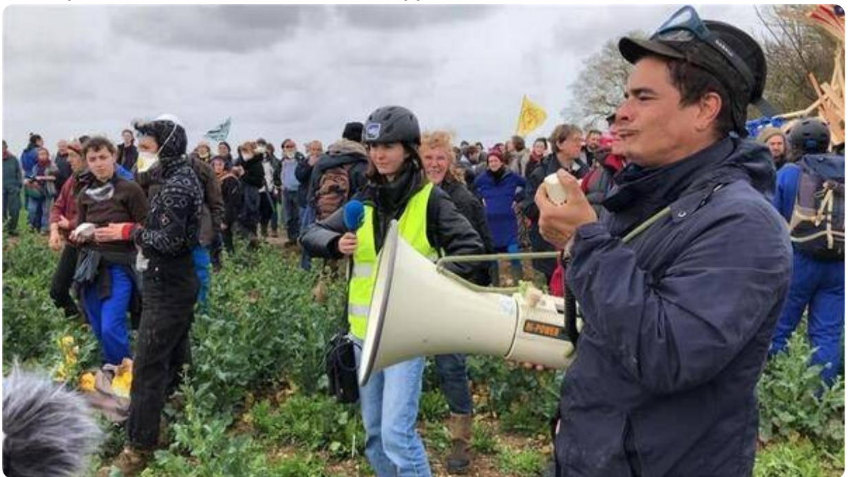
Les organisateurs veulent encercler la bassine de Sainte-Soline.

Les esprits commencent à se tendre à l'approche de la bassine de Sainte-Soline.