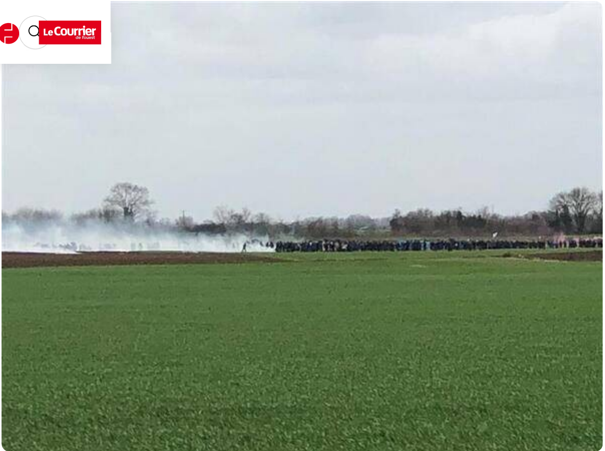
Premiers affrontements.

Premiers face-à-face en approche près de la bassine de sainte-Soline, dans la plaine. Le cortège de la loutre choisi de s'étendre dans les champs pour esquiver la gendarmerie. Qui a finalement quitté le chemin. Les manifestants avancent en scandant « no-Bassaran »