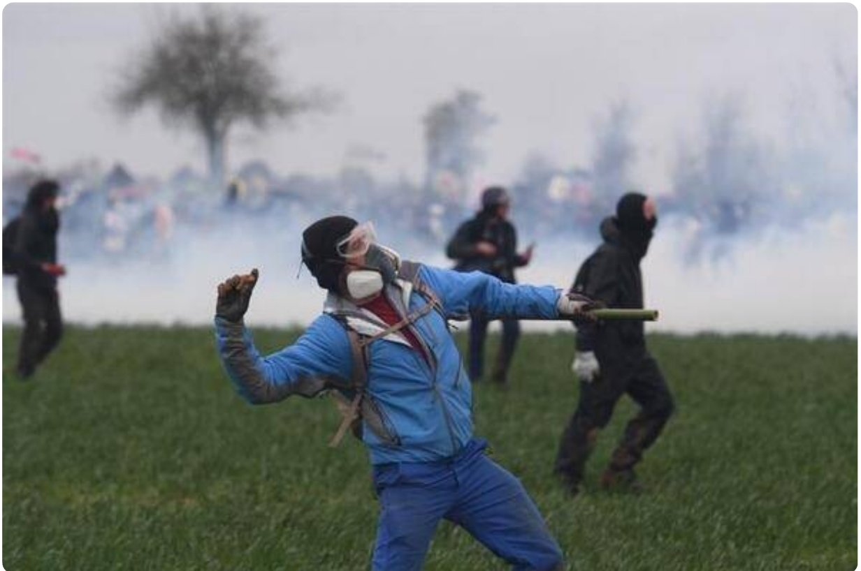
Certains étaient venus avec l'envie d'en découdre.

Les affrontements se sont arrêtés pour l'instant mais une foule compacte reste à côté de la bassine encore.