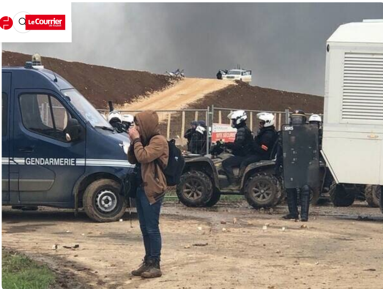
En retrait, les quads sont prêts à intervenir.

13h46 Manifestation anti-bassines à Sainte-Soline. Mortiers et explosifs utilisés contre les gendarmes