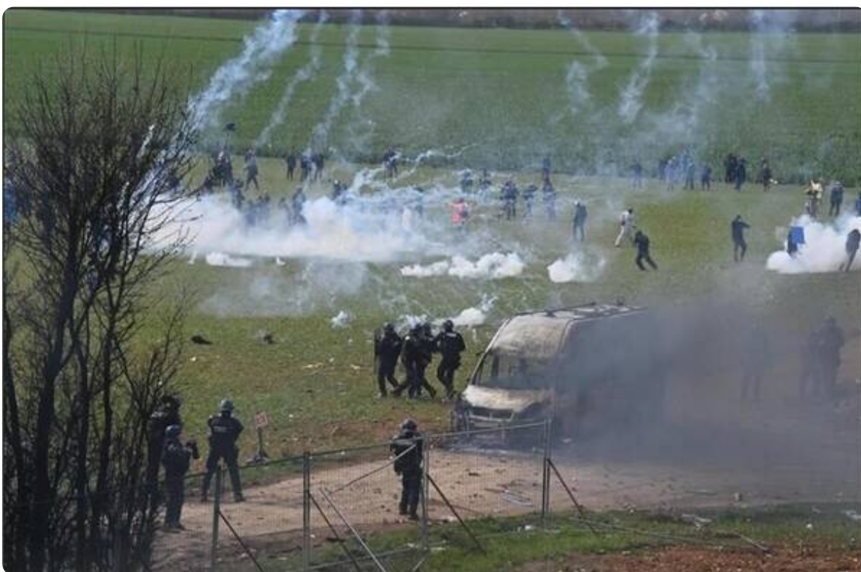
Lors des affrontements.