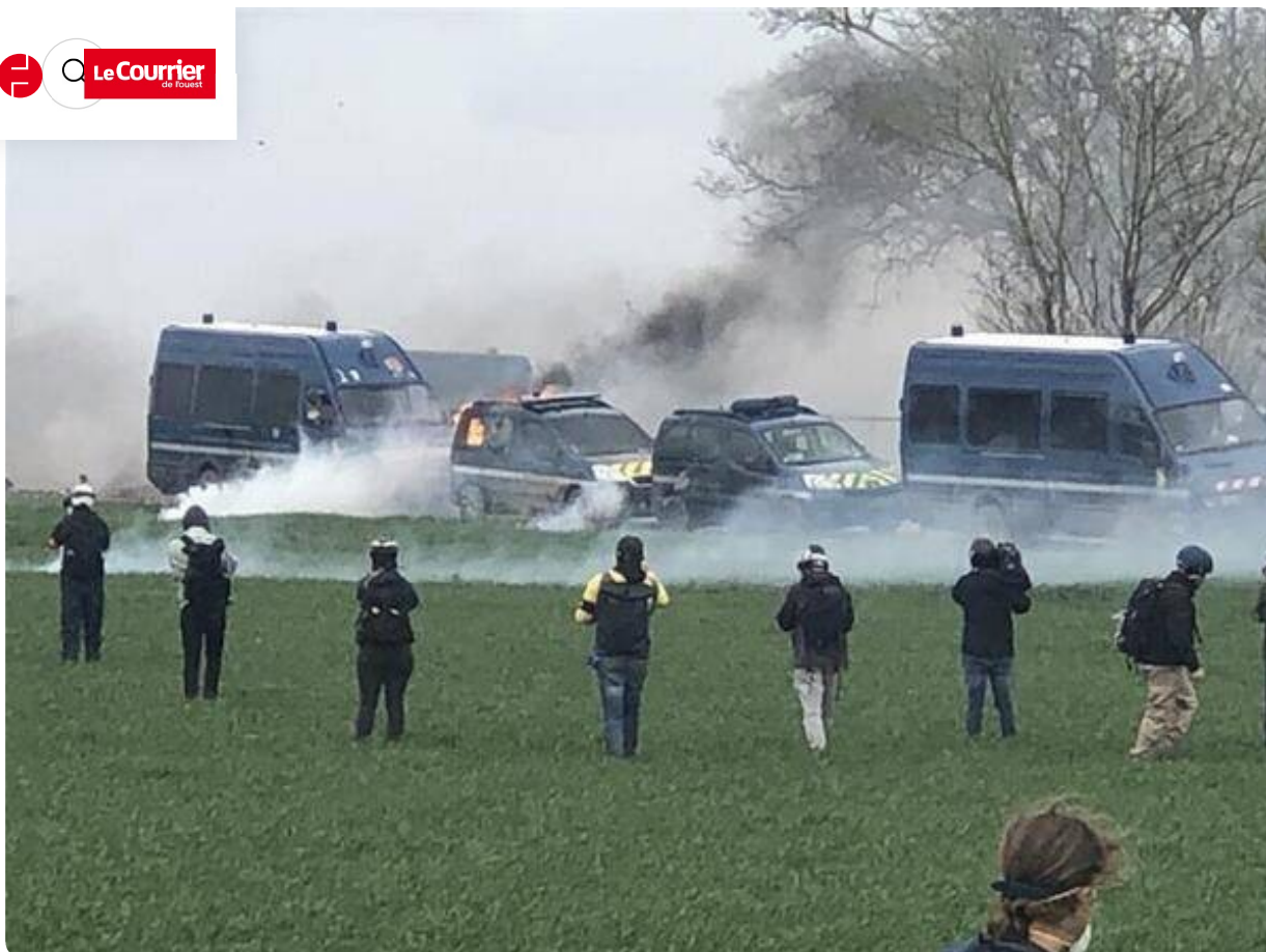
Les véhicules sont la proie des manifestants.

13h17 Manifestation anti-bassines. Les heurts s'intensifient à Sainte-Soline