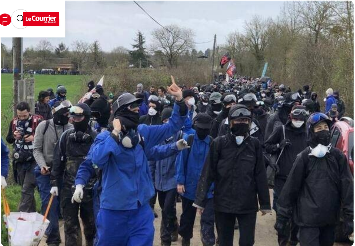
Sainte-Soline n'est plus très loin.

Les esprits commencent à se tendre à l'approche de la bassine de Sainte-Soline.