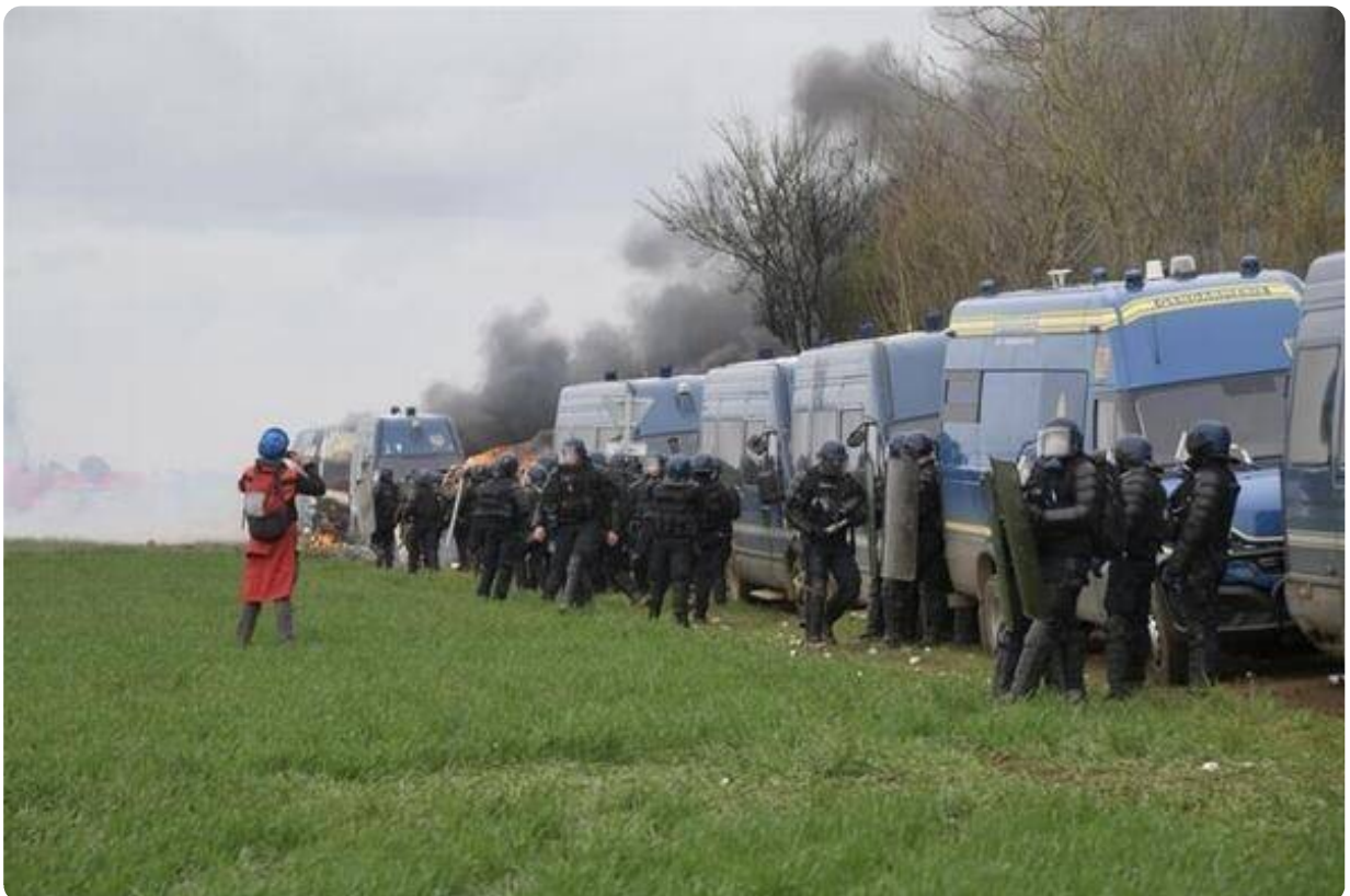
Du renfort est en place.