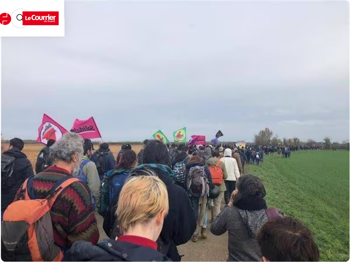
De retour à Vanzay.

Alors que chaque camp panse ses plaies (lire ci-dessous), ceux et celles qui étaient venus manifester pacifiquement ont repris le chemin du camp de base à Vanzay. La journée a été éprouvante pour beaucoup d'entre-eux.