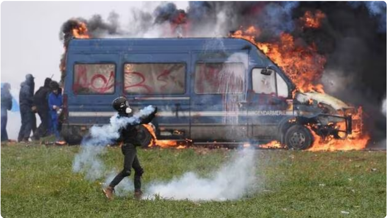
Des affrontements violents ont eu lieu ce samedi à Sainte-Soline dans les Deux-Sèvres.

Aujourd'hui, samedi 25 mars 2023, avait lieu une manifestation contre les réserves de substitution d'eau en construction dans le département des Deux-Sèvres. Ce samedi a été placé sous le signe de l'ultra-violence avec de nombreux blessés chez les gendarmes et les manifestants. Des enquêtes sont en cours pour en déterminer les circonstances. Revivez les temps forts de cette journée avec notre direct.