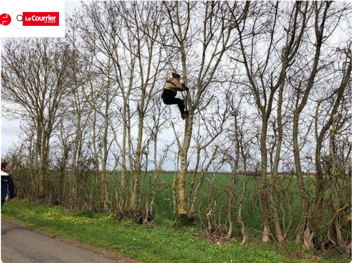
Dans les arbres.