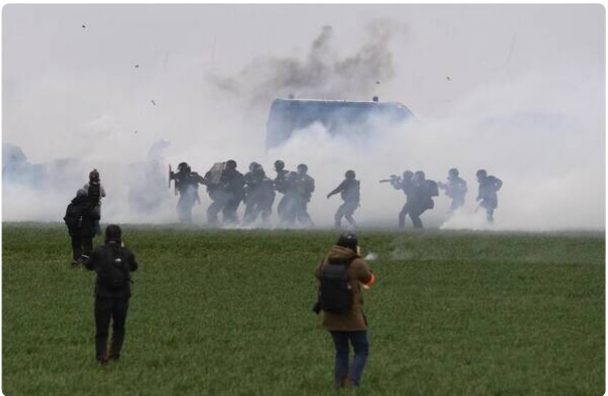
Les photographes tentent de faire leur travail dans le chaos.