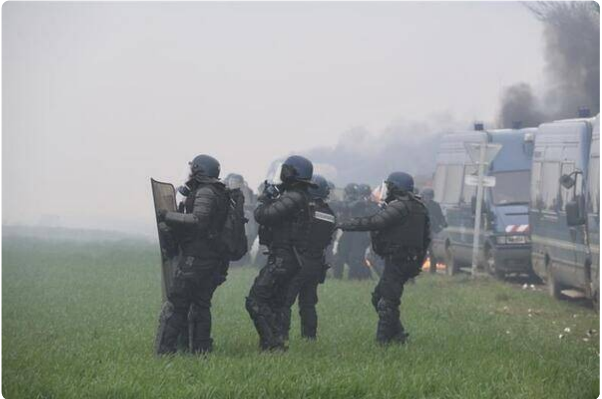
Les forces de l'ordre se replient.