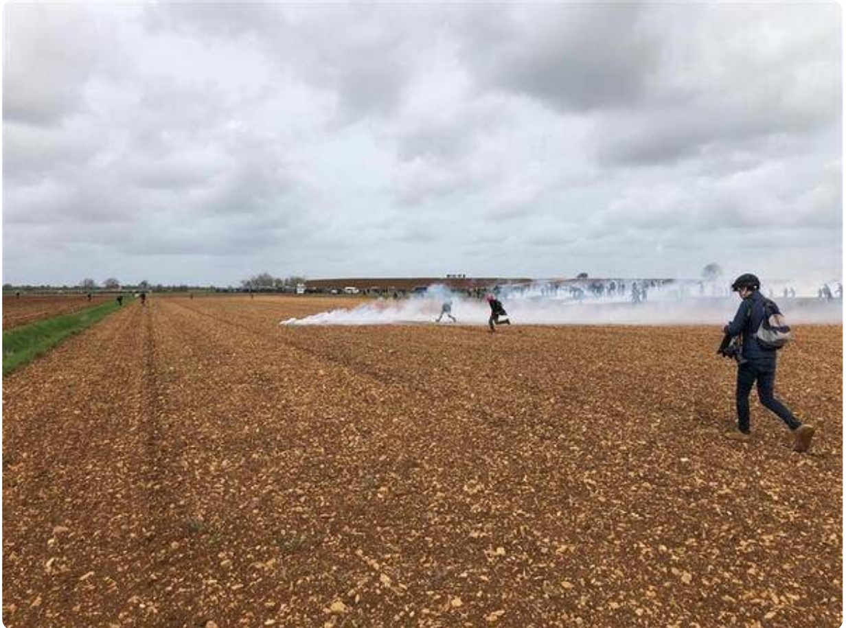
Les lacrymogènes continuent de pleuvoir.

Alors que la préfète appelle ceux et celles qui n'auraient pas d'intention belliqueuse à quitter le site de Sainte-Soline, une pluie de lacrymogène s'abat sur les manifestants. La préfète a par ailleurs autorisé l'emploi de la force " pour maintenir à distance une foule hostile".