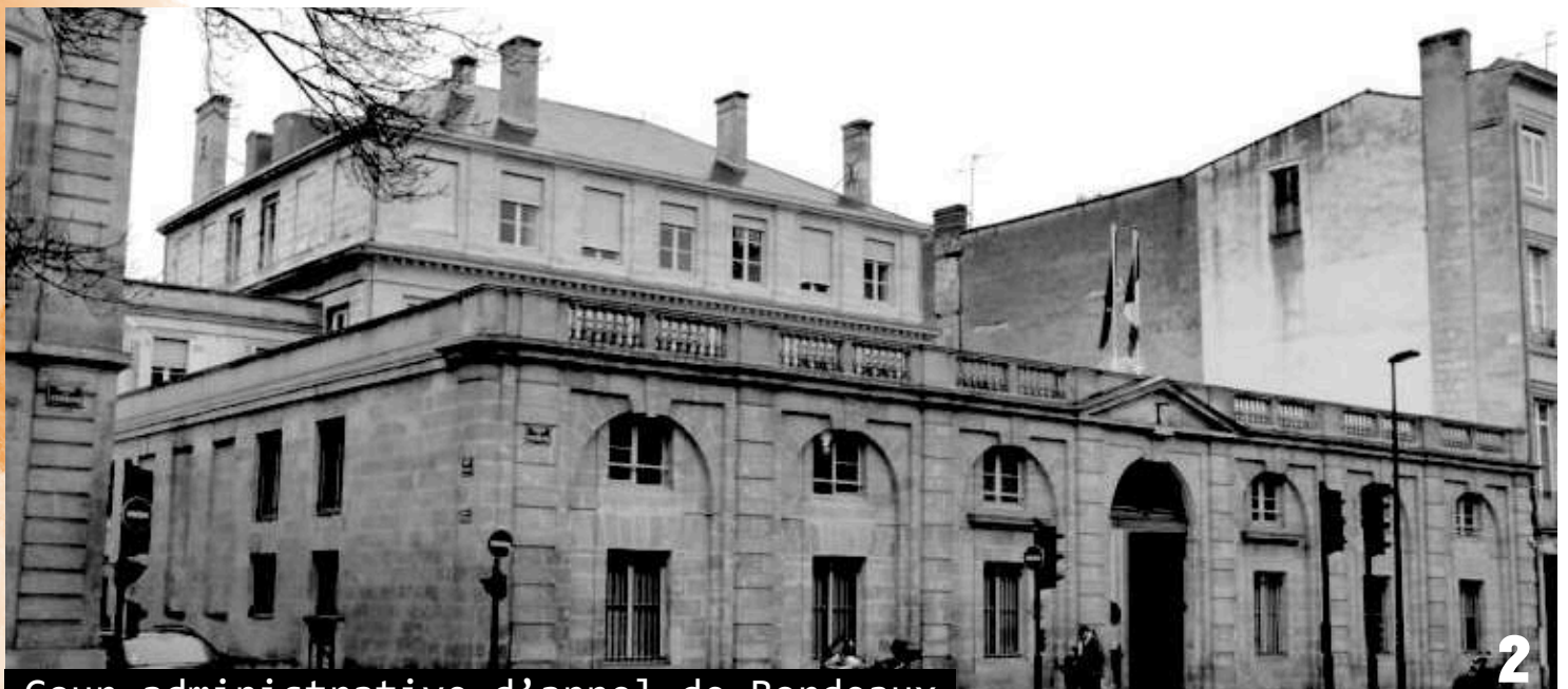
Cour administrative d'appel de Bordeaux

C'est en effet un des éléments majeurs qui explique l'inacceptabilité des bassines. Pour rappel, à Mauzé-sur-le-Mignon, en décembre 2022, la Coop de l'Eau 79 avait rempli pour la première fois la bassine SEV17 alors que la rivière du Mignon était encore assec... C'était la preuve absolue que les niveaux à partir desquels l'eau des nappes (en interrelation avec les cours d'eau) peut être pompée sont trop bas : les rivières ne coulent toujours pas que la Coop de l'Eau 79 peut quand même s'accaparer l'eau des nappes phréatiques.